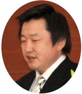
照沼葉山RC会長 30年前に逗子の子クラブとして誕生 今後ともご指導を