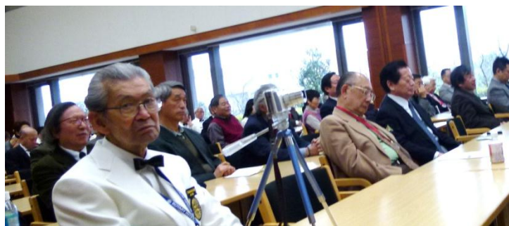
▲ ロフォス湘南の会場を埋め尽くす来場者

アイボリーのブレザーに黒のズボンをユニフォームとして50周年の為揃えた49名の会員が出迎える中、交通機関にも影響した春の嵐が吹き抜けた。お揃いのブレザーは、来訪のロータリアンもビックリ、英国屋さんでの注文?と聞かれた。開会前に49名と奥様で記念撮影。蝶ネクタイは初めての会員が多く、ホテルのボーイサン風や新幹線の車掌風などお互いを批判。