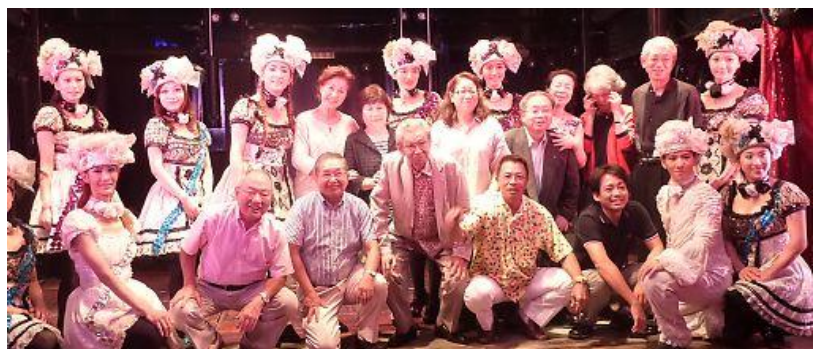
終了後 出演者と記念撮影

老・壮・青が総勢55名参加。首都高の渋滞で多少遅れて到着、早速金魚の舞台に会長・幹事が着席し例会開始、ロータリーソングが響き渡った。金魚の会場は思ったより小さく、田舎の芝居小屋風であった。食事と飲み物で楽しいひと時の客席に、金魚の美女が行き来し会話が交わされる中、ショータイムの時間となった。約10人のショーガールによる踊りが、舞台狭しと立体的に繰り広げられ、瞬く間に時間が経ち幕となった。とにかくきれいなダンサーによるショータイムを楽しむことが出来た。