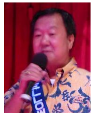
岩堀親睦活動委員長