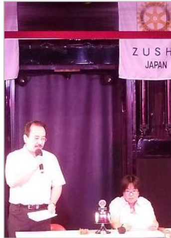
舞台と客席で例会を実施