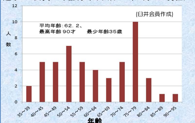
逗子RC会員の年齢分布(平成24年7月1日現在)