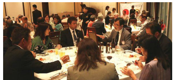
各テーブルでは最終例会ならではの盛り上がり

【出席報告】 会員数 49 名（出席免除 6 名） 出席数 44 名：出席率 89.80% 前回修正出席率 63.83%