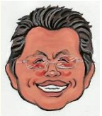
桐田会長の時間 利己と利他

最近世間を騒がすニュースが続出していま す。野球賭博、ロシア国ぐるみドーピング疑 惑、国税局OBの脱税、大学教授の山口組と の関与等々、きりがありません。