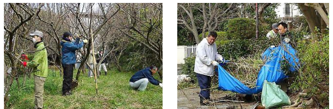
ボランティア 14 名、市緑政課 2 名、RC 会員 10 名が参加