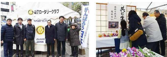
会員 12 名交代で参加 陸前高田竹駒地区に届ける絵馬のメッセージも南相馬・牛越仮設住宅自治会の岡さん達も特産品を販売。クラブより「ぼちぼちこカー」に6万円を贈呈 (防災ひろばにて)