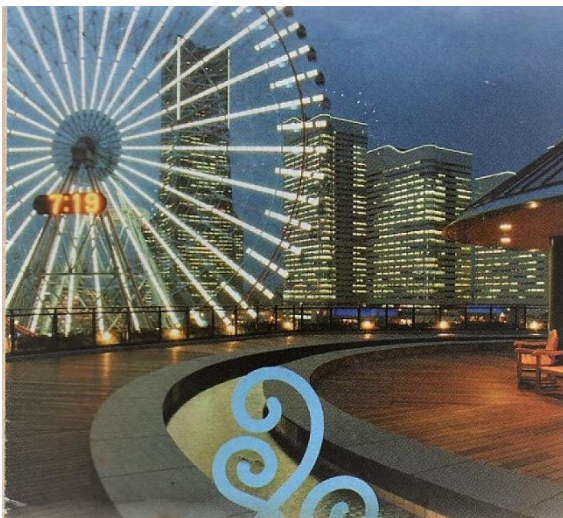
万葉倶楽部の屋上からのみなとみらい

食事処では、目にも舌にも美味しい食の楽しみを使用する素材は旬の魚介類や四季折々の野菜など、一品一品を、おもてなしの心を、飲み物は、菊池会長からの心づくしの飲み放題。身体をゆったりと横たえ、55周年の疲れをとり、憩いの時間を過ごしました。(橘 武)