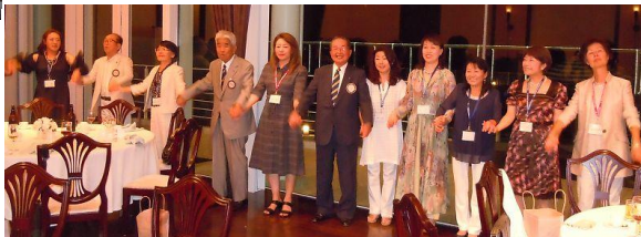
フィナーレは全員輪になって「手に手つないで」の合唱