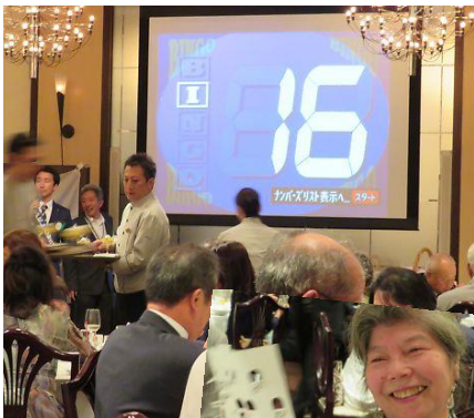
豪華景品 どっさり！ 盛り上がりましたビンゴゲーム 〈担当 宝子山〉