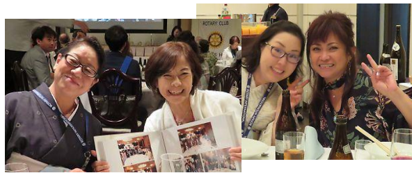
最終例会に華を添えた奥様方