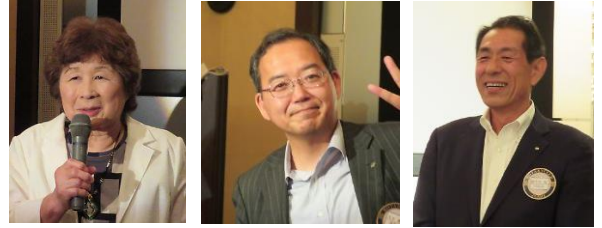
新人会員ユーモアたっぷりに抱負を語る