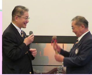
村松会長へバトンタッチ 次年度よろしく