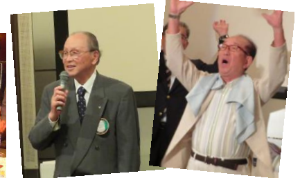
最後の締めはやっぱりこのお二人