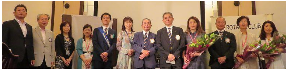
菊池年度の会長・副会長、村松年度の会長・副会長・幹事と奥様勢揃い