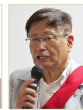
橋 武 SAA