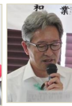
横山副幹事 幹事代理を務める