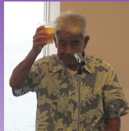
福嶋会員の発声で乾