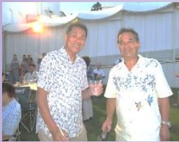
バーベキューを楽しんで、各テーブルは笑顔が並ぶ