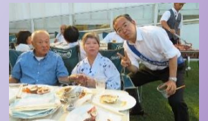
屋外ガーデンでの楽しく美味しいバーベキュー