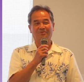
「会員の親睦の時間を大事にしたい」と会長の時間