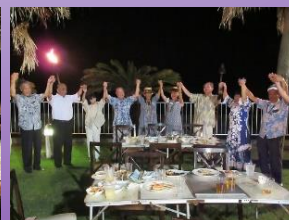
エンディングは、定番♪手に手つないで♪