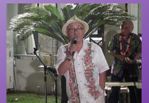
締めはウィット満載の村田会員