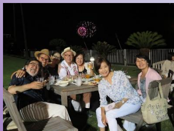
葉山の花火と共に