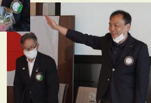
ニコニコ、本日目標達成、ありがとう！