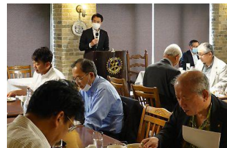
6/25 開催 クラブ協議会 18名参加