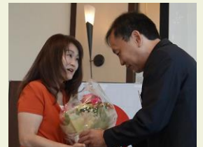
一年間お世話になりました