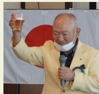
亡くなられた会員のご冥福を祈り献杯！