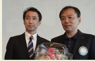
大役を終える大野会長 緊張の勾坂次年度会長