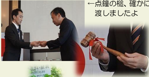
←点鐘の槌、確かに渡しましたよ