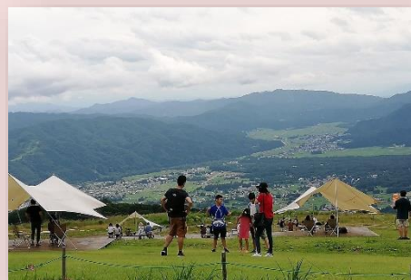
「白馬岩岳から白馬村を望む」（清水恵子会員）