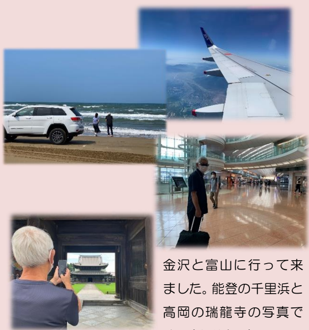
金沢と富山に行ってきた。能登の千里浜と高岡の瑞龍寺の写真です。（山科会員）