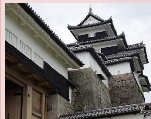
白河小峰城三重櫓を見学 （日本百名城の一つ）