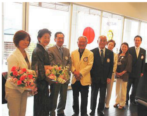
平成 21 年度神奈川県環境保全功労者・横須賀三浦地域県政総合センター所長表彰受賞(みどりの功労) ↑