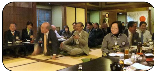
大笑いの 会員たち