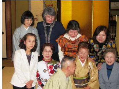
会員の奥様方と師匠