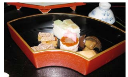
日影茶屋 懐石料理