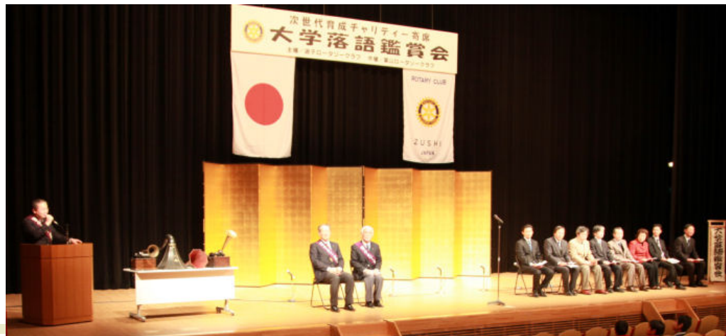
観客：午前の部 70 名 午後の部 270 名。 大学 OB、他のお手伝い多数。RC 会員 27 名参加。出演の学生はじめ、観客には好評にて無事終了。関わって下さった皆様方に感謝。