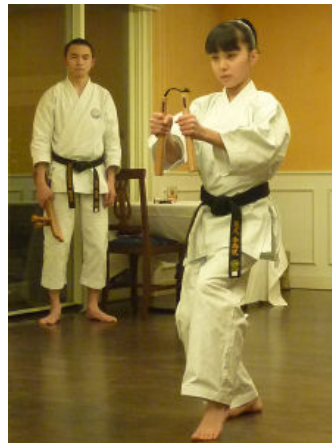
ご子息 太志君(15才) 奈都実さん(12才)の演武↑

私は空手道をもって子ども達、父兄、この湘南の地域にこの精神を伝えていこうと思っています。