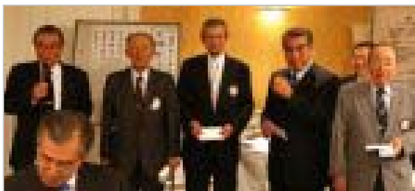
10月のお祝 結婚46周年、良くもちました 山口会員