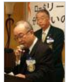
大島ガバナー補佐 ガバナー紹介