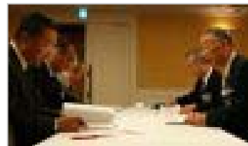
ガバナーと三役の懇談会