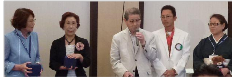
↑ 6月のお祝い ↓ 会話と料理と音楽を楽しむ

「更なる友情と奉仕を・・・逗子 RC スピリッツが増々強固に・・・」を全員が実感した。