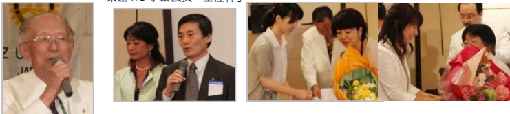
最後の締めはやはり桐ヶ谷会員。出席者全員の心が一つに。