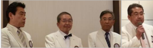
7月から背負う重みの為か？ 緊張気味の次年度三役

「更なる友情と奉仕を・・・逗子 RC スピリッツが増々強固に・・・」を全員が実感した。