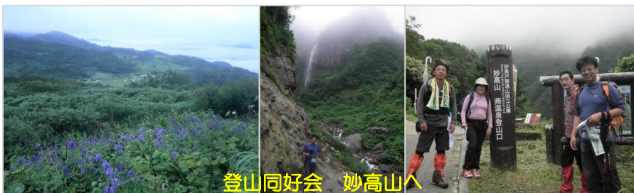
登山同好会 妙高山へ