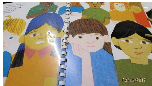
絵本を一旦ばらしシートに点字を打ち込む