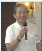
菊池会員増強・退会防止委員長の司会進行によるフォーラム