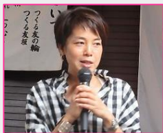
橋本地区会員増強・会員維持委員 (鎌倉中央 RC)

また、時間、年齢、金銭、人脈等で想定される障害要素の解除の方法を事前に用意しておく。