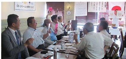
各自、鏡を持って笑顔のトレーニングをする様子