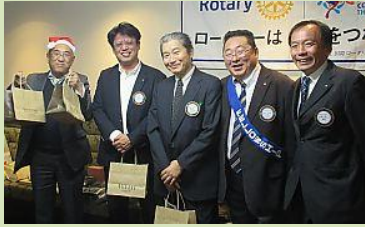
お誕生日おめでとうございます