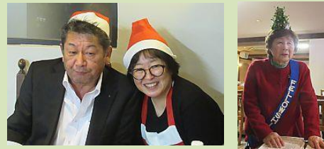
親睦の皆様ありがとうございました