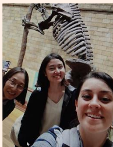
財団留学生の仲間と

一年目 は、シュルーズベリーに現存する図書館の再生を、ホームレスのための社会復帰支援アート学校としてコンバージョンする提案した