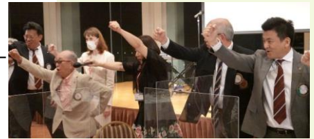
逗子 RC 100 周年に向けて eiείο-