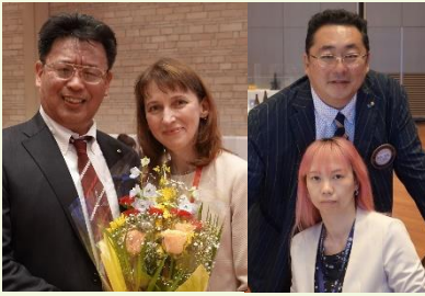
一年間お疲れ様 ありがとう！

第 2877 回例会 6 月 16 日(木)於:鎌倉プリンスホテル 46 名出席(パートナー・ゲスト含む)