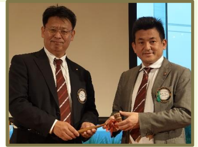
徳永年度 よろしく！

普段はばらばらに見えても、いざとなったら一つとなってイベントを成功させるのが、逗子ロータリークラブです。老壮青、皆さん一人一人があつての逗子ロータリークラブです。このクラブに入ってよかったと思った1年間でした。改めて皆様、ありがとうございました。