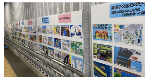
昔の駅周辺の写真・小学生の絵画展示