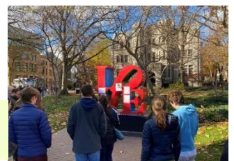
ペンシルベニア大学： 最初の医学部ができた