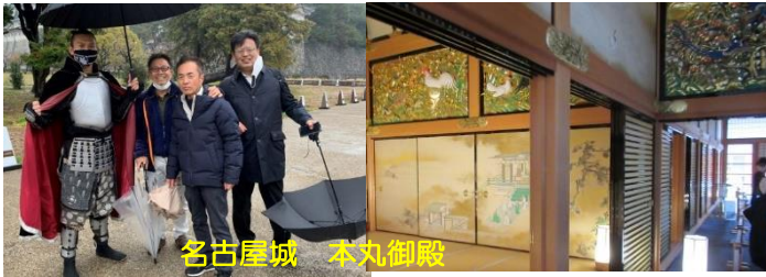
名古屋城 本丸御殿