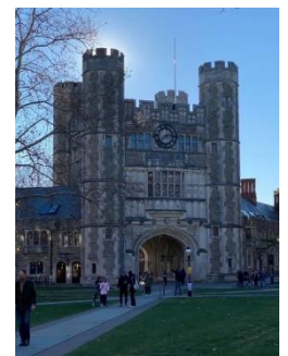
プリンストン大学： アインシュタインが研究していた。自然に囲まれた広い敷地