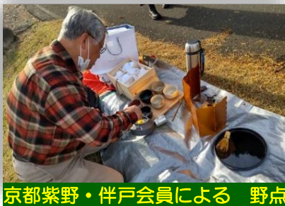
京都紫野・伴戸会員による 野点