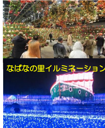
なばなの里イルミネーション

11月24日(木) ゴルフ組：東建多度カントリー倶楽部 観光組： ★名古屋海洋博物館 南極観測船ふじ ★柿安本店で昼食 ★六華園