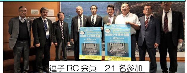
逗子 RC 会員 21名参加