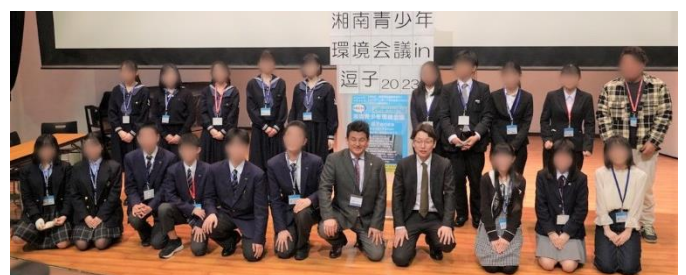
湘南青少年環境会議で発表した中・高生