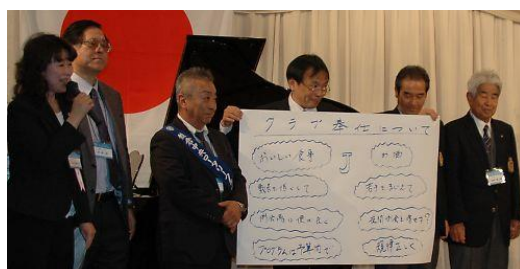
5クラブ 合同の委員会毎のディスカッションの発表